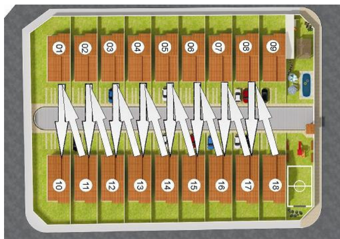
Figura 2 – Planta de situação e seqüência de execução

Antes da implementação dos conceitos e ferramentas enxutas, a construtora não tinha nenhum procedimento padrão relativo ao planejamento e controle de seus projetos. Todas as decisões eram tomadas baseadas na experiência do diretor da construtora e de seus colaboradores. Assim, o primeiro passo no estudo foi o de definir cuidadosamente a seqüência e a estratégia de execução para as 17 casas restantes, e definir a capacidade produtiva disponível para o projeto. Neste momento, a duração do projeto foi fixada e o mesmo deveria ser concluído em 8 meses, da mesma forma os recursos foram definidos para apoiar essa mesma duração. A seqüência de execução foi então definida e as equipes deveriam começar a execução da casa 18 até casa 10, alternando os lados, como indicado na figura 2.