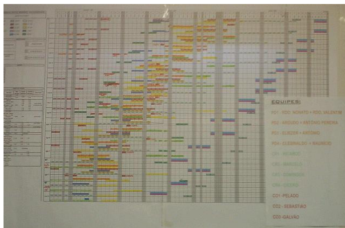
Figura 3 - Linha de balanço

planejado aos gerentes do projeto, supervisor e equipes. Até o momento, essas decisões eram mantidas para o gerente de projeto e para a diretoria da construtora que comunicava as decisões aos demais envolvidos com a construção do empreendimento quando necessário. A linha de balanço (LB) foi a ferramenta escolhida para representar o planejamento de longo prazo do empreendimento por causa de sua facilidade de uso e habilidade em comunicar conceitos importantes como continuidade, ritmo de trabalho e folgas às equipes de produção como também informações relacionadas às durações de atividades, interferências entre equipes, e local de trabalho. A LB para o empreendimento foi desenvolvida usando-se MS Excel® (figura 3).